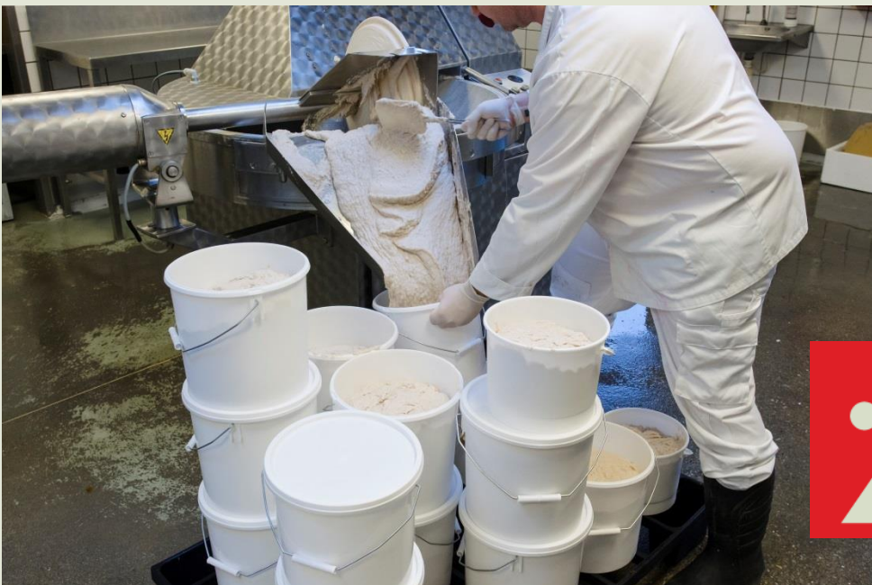
Ophobning af færdig fiskefars udenfor køl