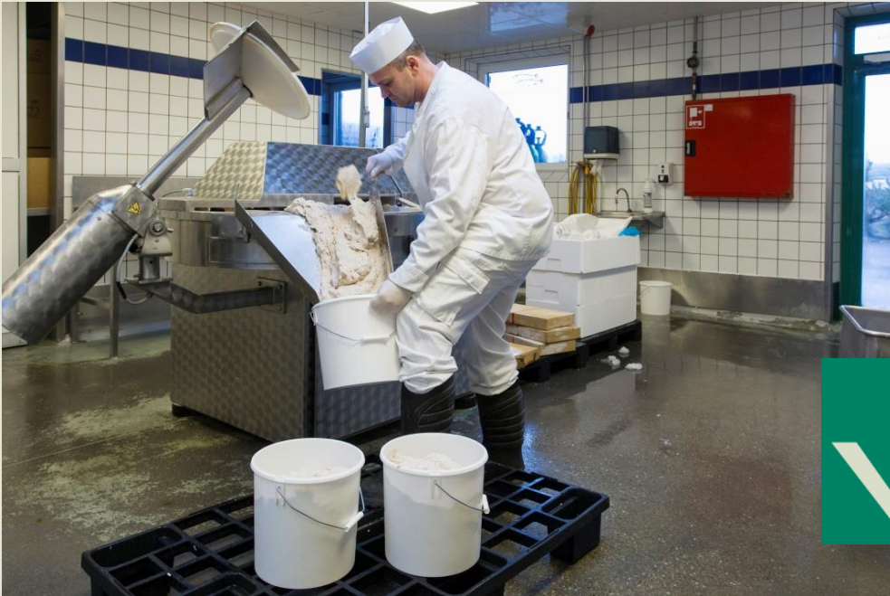
Udportionering af fiskefars